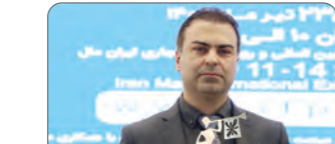
جدیدترین محصول کار دو کارتن بوکان برای داروسازان