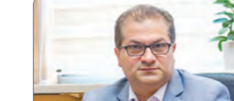
«سنپاک»، آمیزه ای از صنایع دستی و بسته بندی مدرن