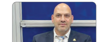
عرضه مرکب و شوینده های لیبل «دوستان شیمی آسیاب»