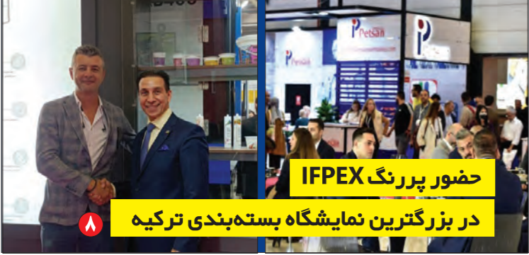
حضور پررنگ IFPEX